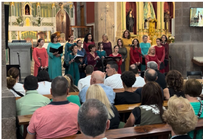
Actuación del Coro Femenino Memvus Arte en la Iglesia de la Candelaria en Ingenio.