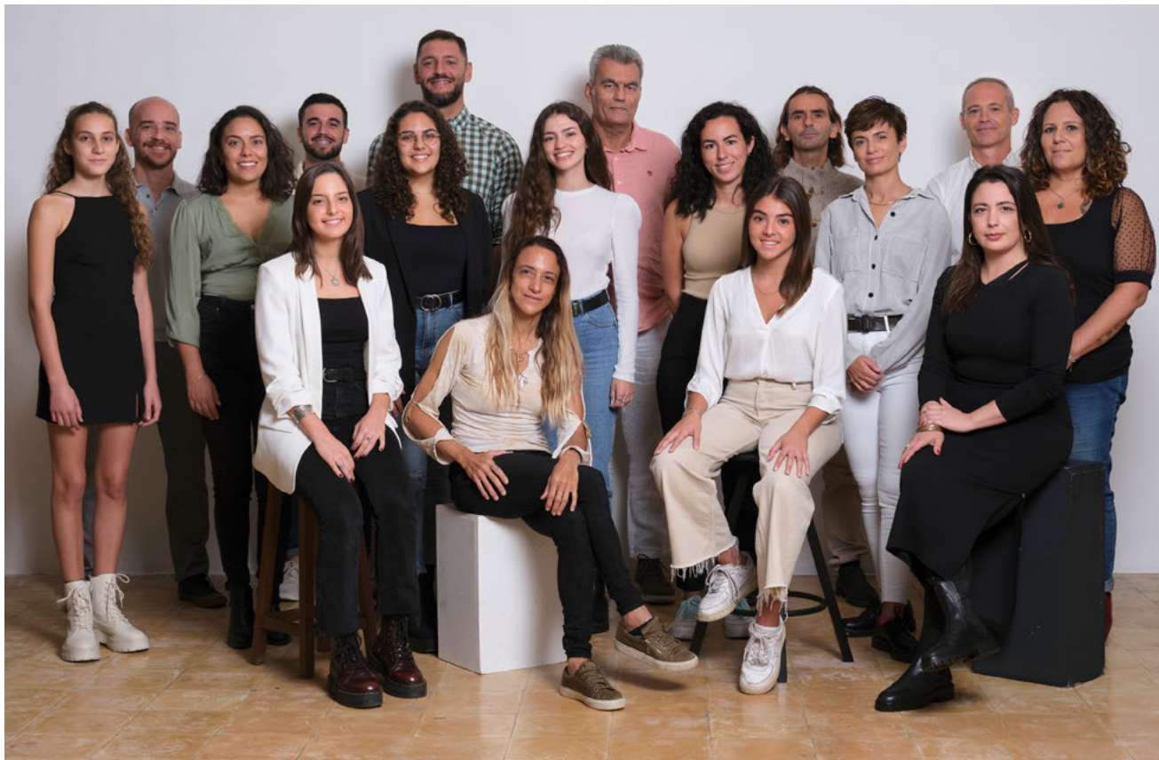
Integrantes de la Asociación Artística Memvus.

De esta colaboración surgen los dos principales espectáculos anuales que caracterizan a Memvus Arte —extensión artística de la Escuela Memvus—: “Función de Invierno”, que se representa en el Auditorio Alfredo Kraus y “Volcánica”, que se celebra en el Teatro Pérez Galdós. Ambos se distinguen por la fusión de música, danza, declamación y creación audiovisual.