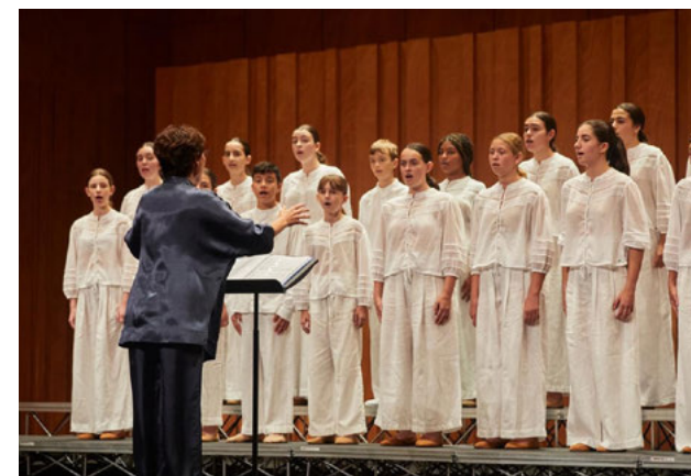
Coro de Voces Blancas Memvus Arte en el Concurso Internacional "Sing for Gold".