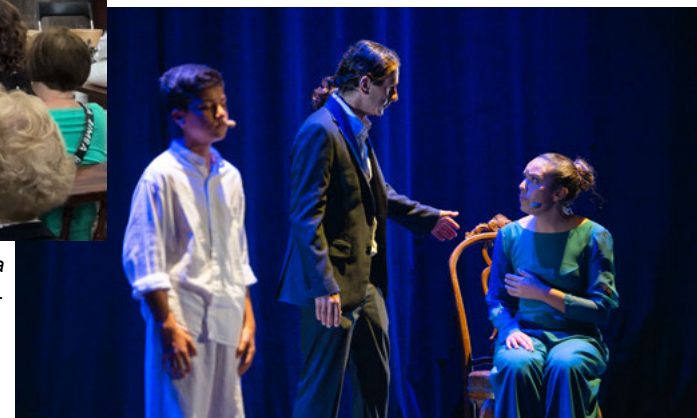
Un momento de Volcánica VIII - La Canción de Machado.