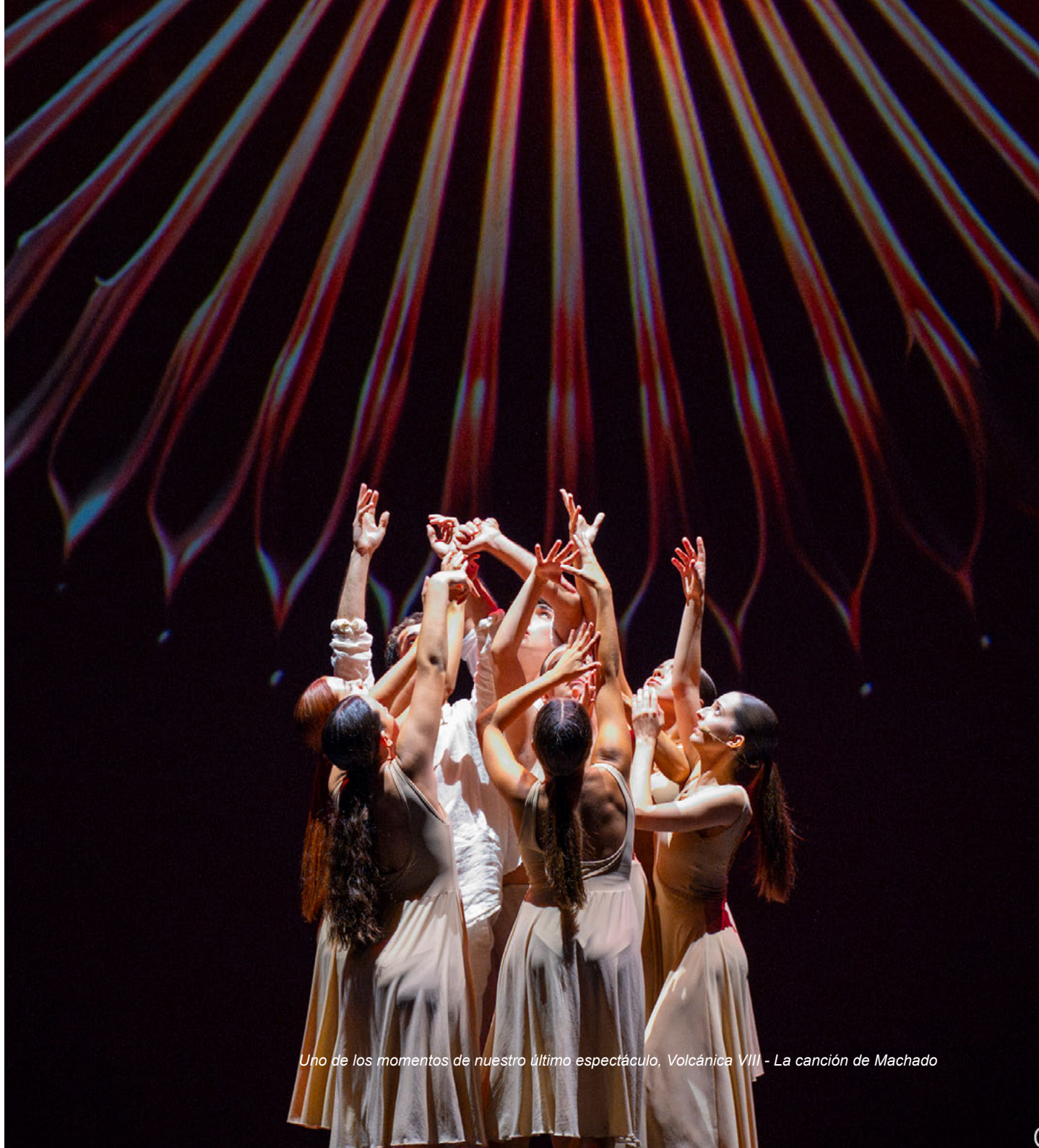
Uno de los momentos de nuestro último espectáculo, Volcánica VIII - La canción de Machado