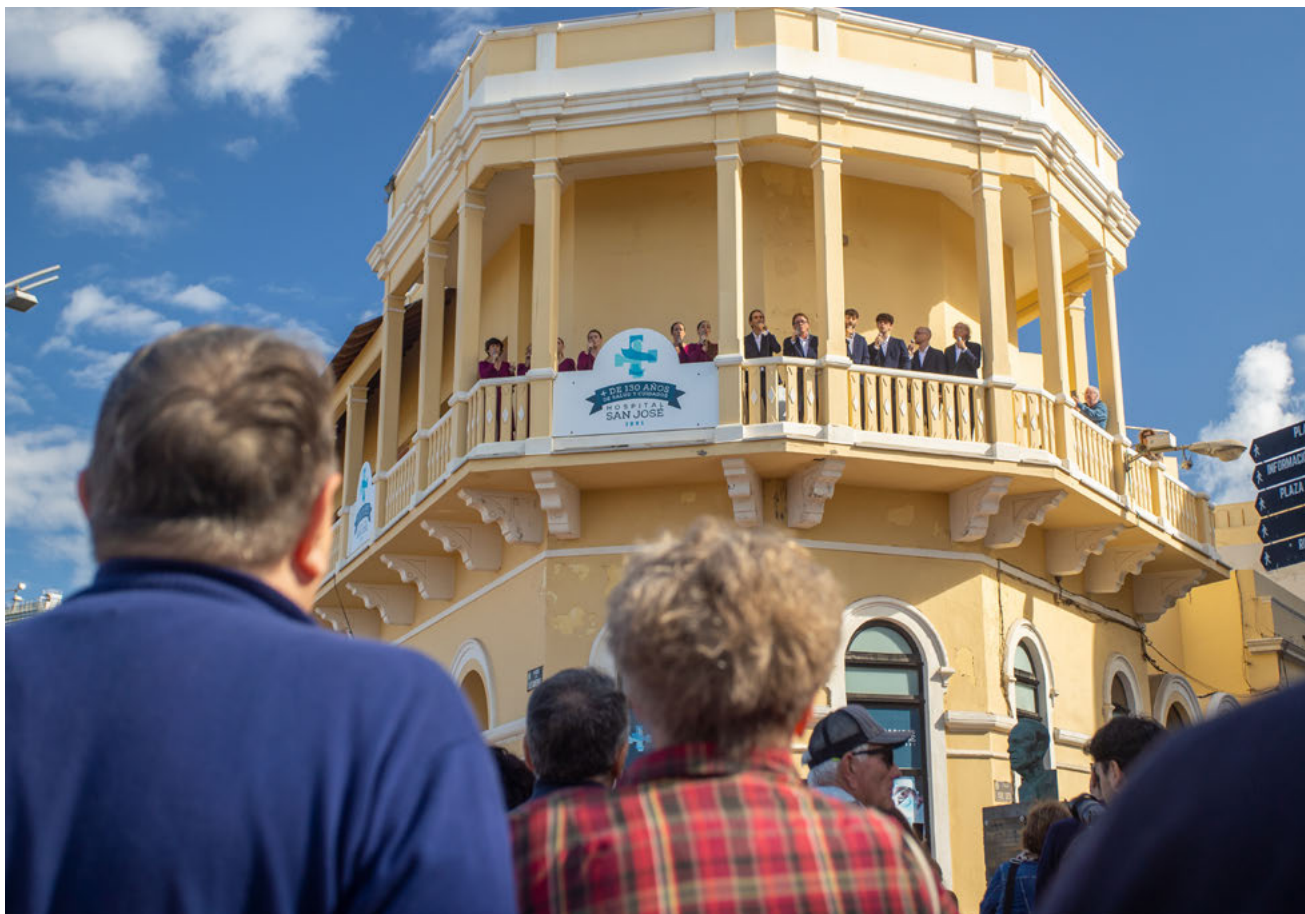
El Coro Mixto Memvus Arte durante su tradicional actuación navideña en el balcón del Hospital San José.

A todas estas participaciones artísticas se suma la colaboración con los hermanos Thioune durante el mes de abril, en un acto solidario celebrado en el Paraninfo de la ULPGC, el concierto coral en el Convento de las Dominicas de Teror, lugar que, además acogió la convivencia anual que realiza la escuela antes del estreno de Volcánica.