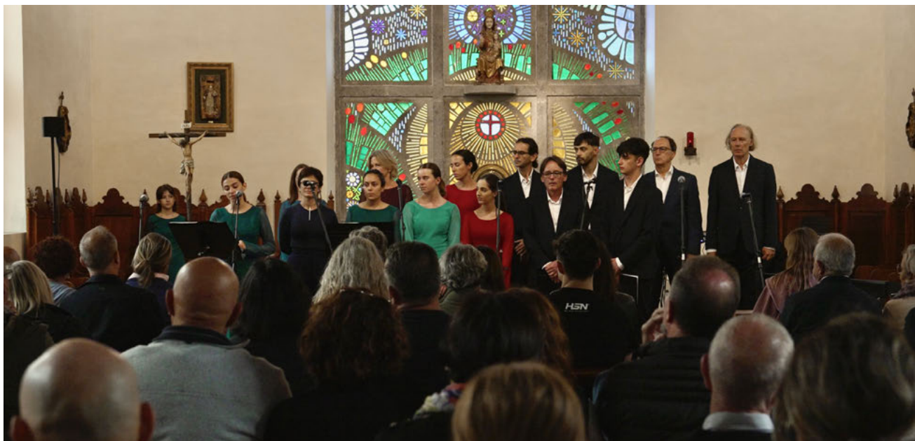
Actuación del Coro Mixto Memvus Arte en el Convento de las Dominicas de Teror.

Esta sexta edición de Función de Invierno, además de en el Auditorio Alfreda Kraus, se representó en el Centro Cultural Federico García Lorca de Ingenio. En esta función destacó la participación de Amidagüe — la agrupación musical constituida por personas con diversidad funcional, a las que la Escuela Memvus forma en su colaboración con la asociación Apadesur de Ingenio—, así como la de los jóvenes ingenienses que forman parte del proyecto desarrollado por la entidad en este municipio y que reciben una rica