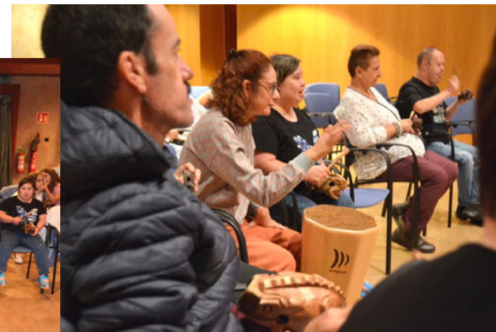
Miembros de Amidagüe durante su formación y en la preparación de uno de nuestros espectáculos.