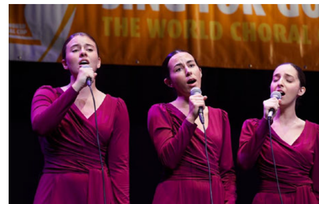
El Coro Mixto Memvus Arte durante su actuación en el Concurso Internacional "Sing for Gold".