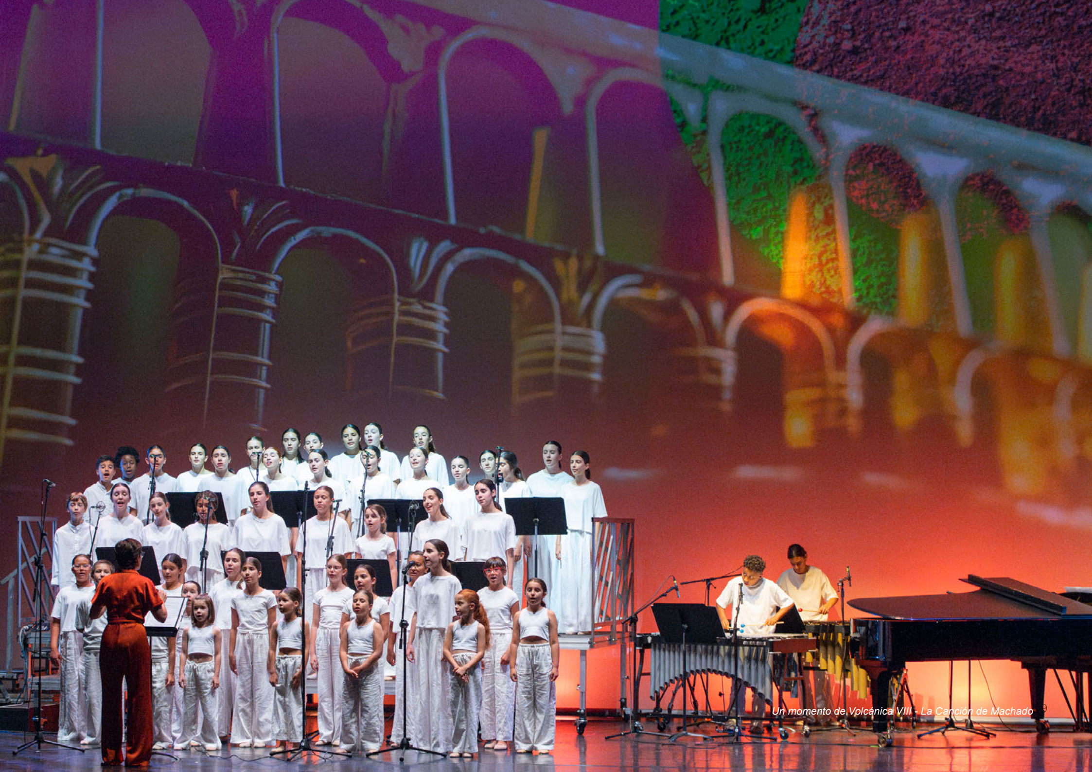
Un momento de Volcánica VIII - La Canción de Machado